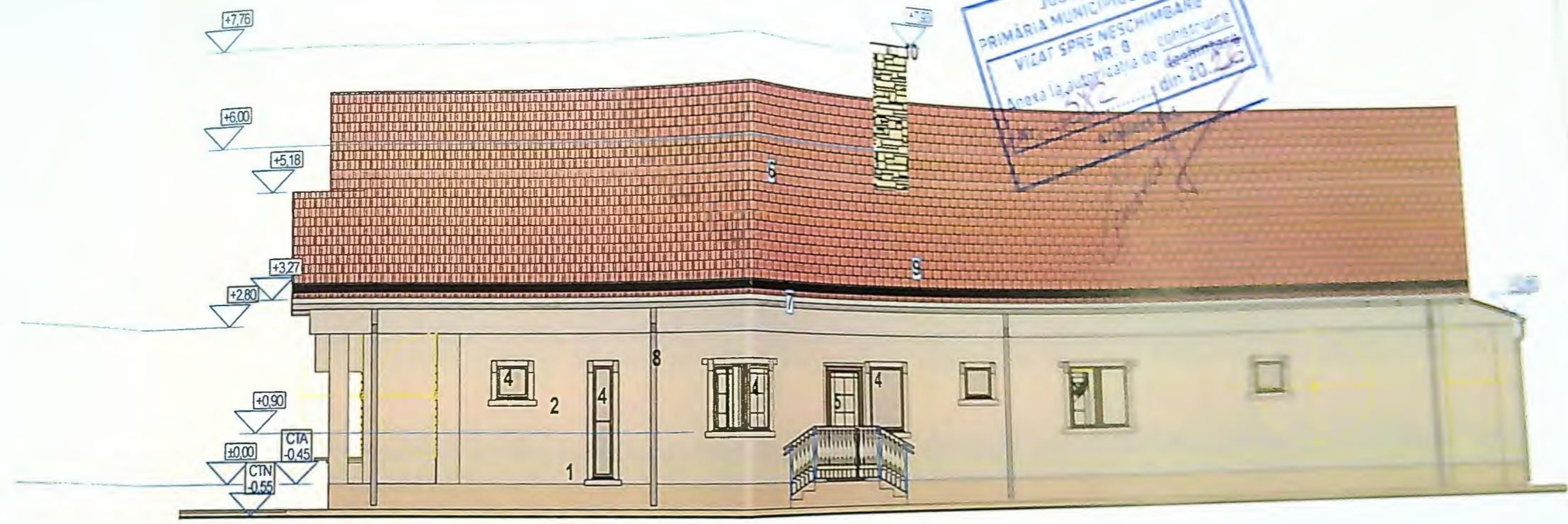
FATADA LATERALA DREAPTA-DE SUD

JUDETUL DOLJ PRIMĂRIA MUNICIPIULUI CRAIOVA VIZAT SPRE NESCIMBARE NR. 8 Anexa la autorizația de construire destinată din 20.12.2015